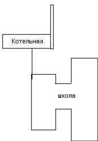
Рис. 2.3.2. Схема тепловой сети котельной №2 с Долганка №2